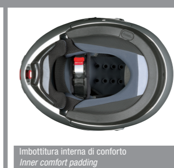
Imbottitura interna di conforto Inner comfort padding