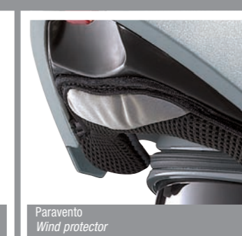
Paravento Wind protector