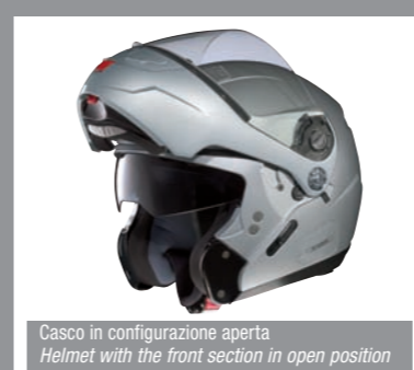
Casco in configurazione aperta Helmet with the front section in open position