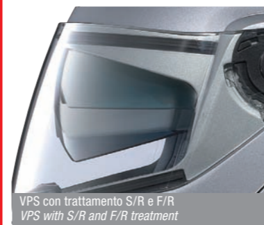
VPS con trattamento S/R e F/R VPS with S/R and F/R treatment