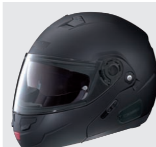
CLASSIC N-COM 10 flat black