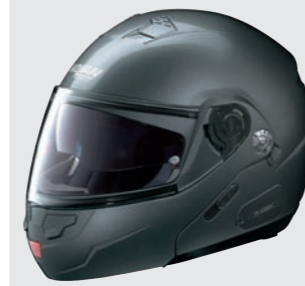
CLASSIC N-COM 4 lava grey