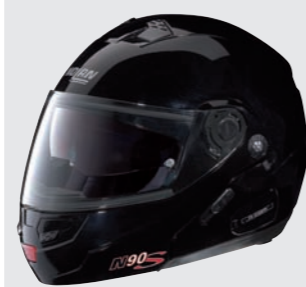
SPECIAL N-COM 8 metal black