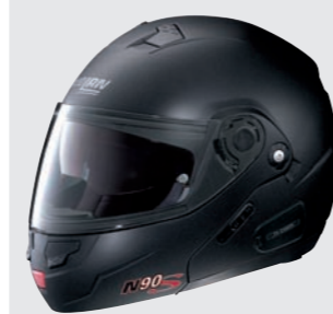
SPECIAL N-COM 9 black graphite