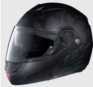
SHADE N-COM 12 flat black