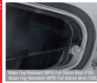
Nolan Fog Resistant (NFR) Full Silicon Bind (FSB) Nolan Fog Resistant (NFR) Full Silicon Bind (FSB)