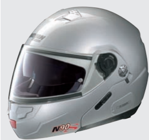
SPECIAL N-COM 7 salt silver