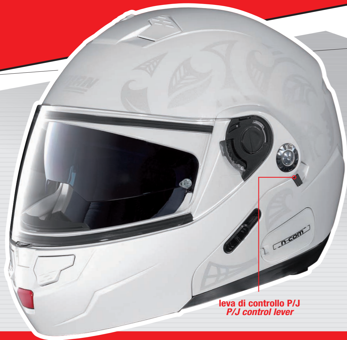
leva di controllo P/J P/J control lever