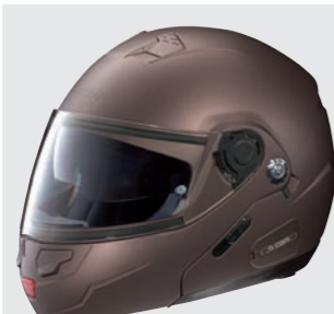
CLASSIC N-COM 6 flat moka