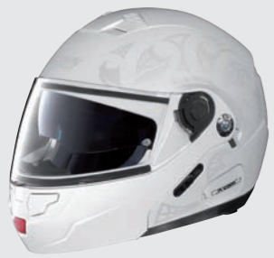
SHADE N-COM 11 metal white