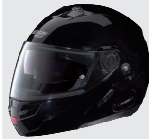
CLASSIC N-COM 3 glossy black