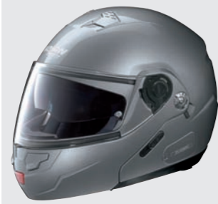
CLASSIC N-COM 2 arctic grey