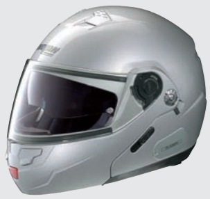
CLASSIC N-COM 1 platinum silver