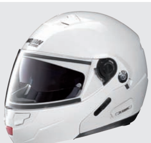
CLASSIC N-COM 5 metal white