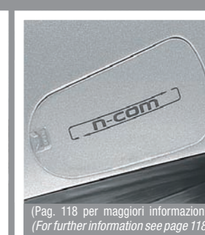
(Pag. 118 per maggiori informazioni) (For further information see page 118)